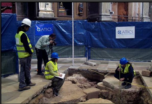
Aixecament topogràfic Basílica de Santa Maria de Mataró.