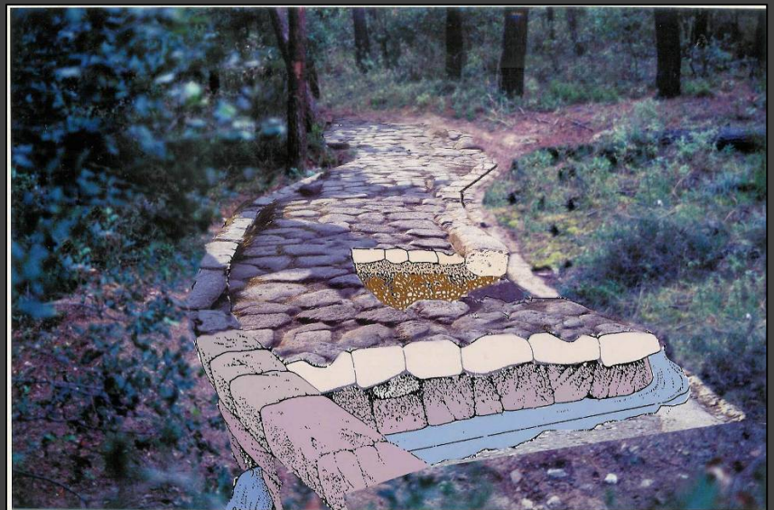
Reconstrucció ideal en 3D de la Via de Parpers d'Argentonà.